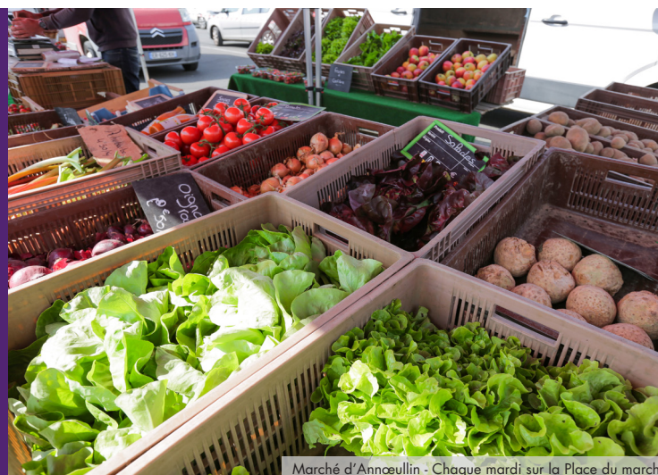
Marché d'Annœullin - Chaque mardi sur la Place du marché