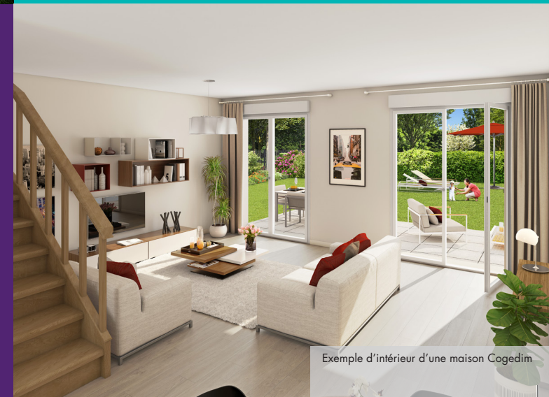
Exemple d'intérieur d'une maison Cogedim