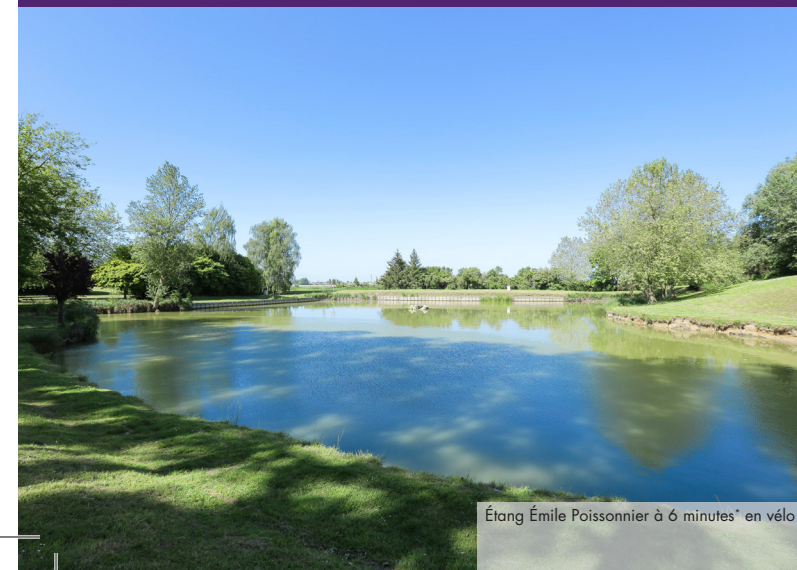
Étang Émile Poissonnier à 6 minutes* en vélo