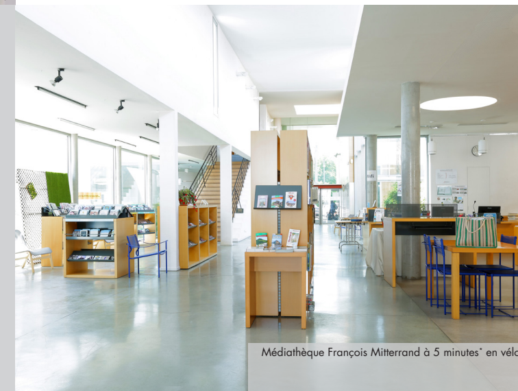
Médiathèque François Mitterrand à 5 minutes* en vélo