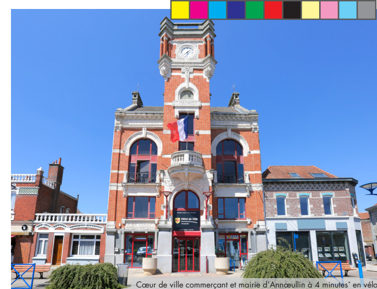
Cœur de ville commerçant et mairie d'Annœullin à 4 minutes* en vélo

Annœullin s'inscrit dans la dynamique de la métropole lilloise. Proche des grands axes et autoroutes, la ville bénéficie d'une situation géographique exceptionnelle. Cette ville à taille humaine accueille des événements culturels et sportifs grâce à ses infrastructures. On y rit avec le festival Les Annœull'rire, on y vibre au rythme de l'histoire avec la fête médiévale, on s'y divertit au festival de théâtre et on s'y cultive avec la médiathèque. Annœullin permet aux familles de s'épanouir à chaque âge et cumule les avantages citadins à ceux de la campagne à seulement 20 minutes* de Lille et de Lens.