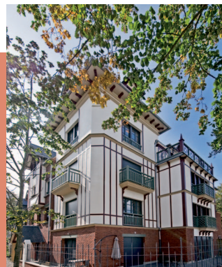
Villa Victoria à Saint-Valéry-sur-Somme

Acteur local et régional engagé aux côtés de ceux qui, chaque jour, contribuent à façonner le visage des villes et territoires de demain, VINCI Immobilier compte parmi les intervenants économiques majeurs dans les Hauts de France, avec des réalisations qui font référence dans cette région. Pour vous, la garantie de pouvoir compter sur une réelle proximité.