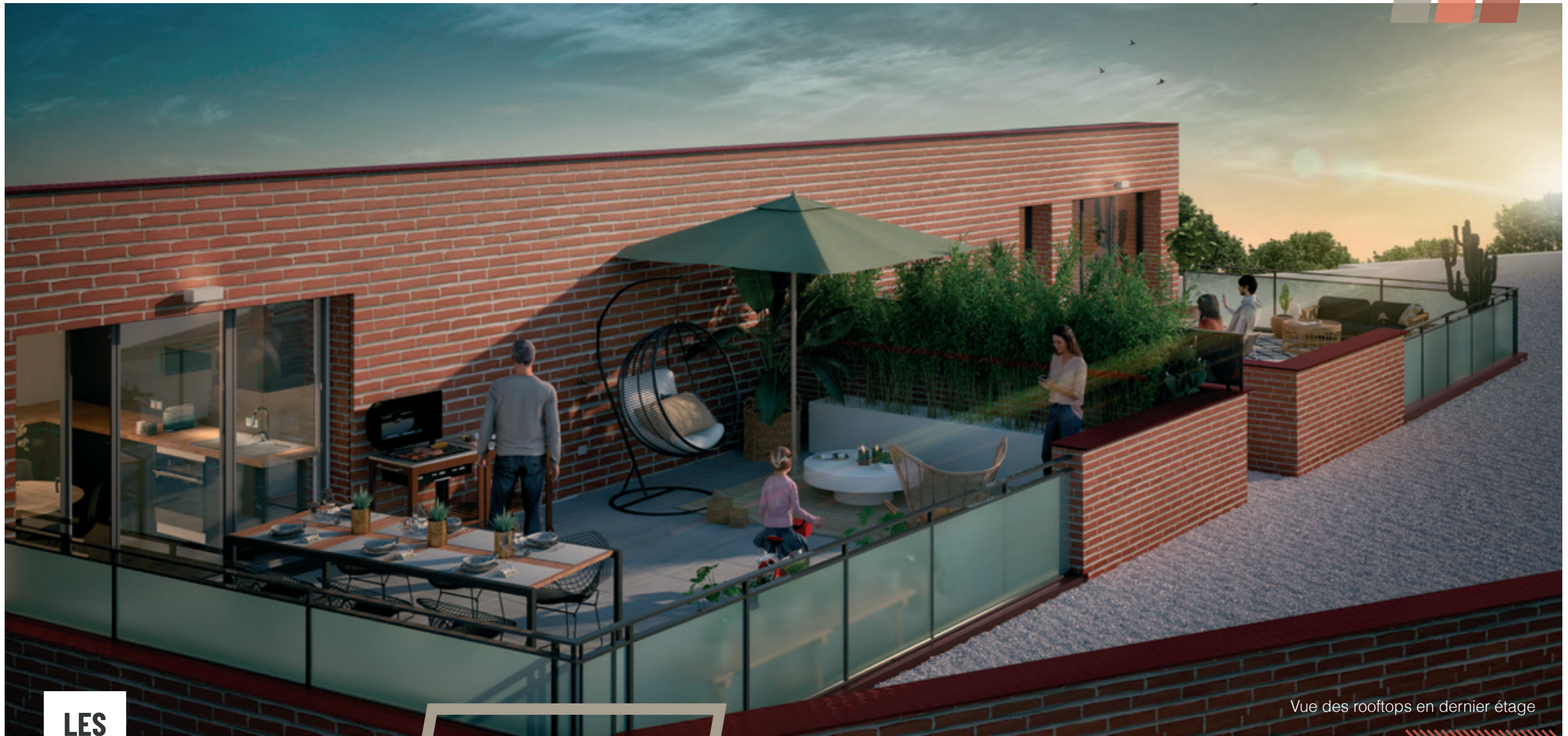
Vue des rooftops en dernier étage