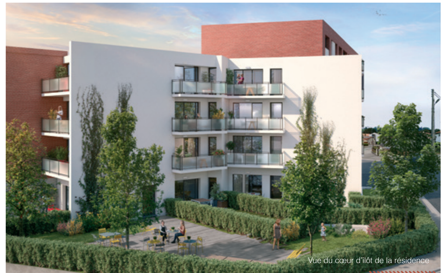
Vue du cœur d'îlot de la résidence