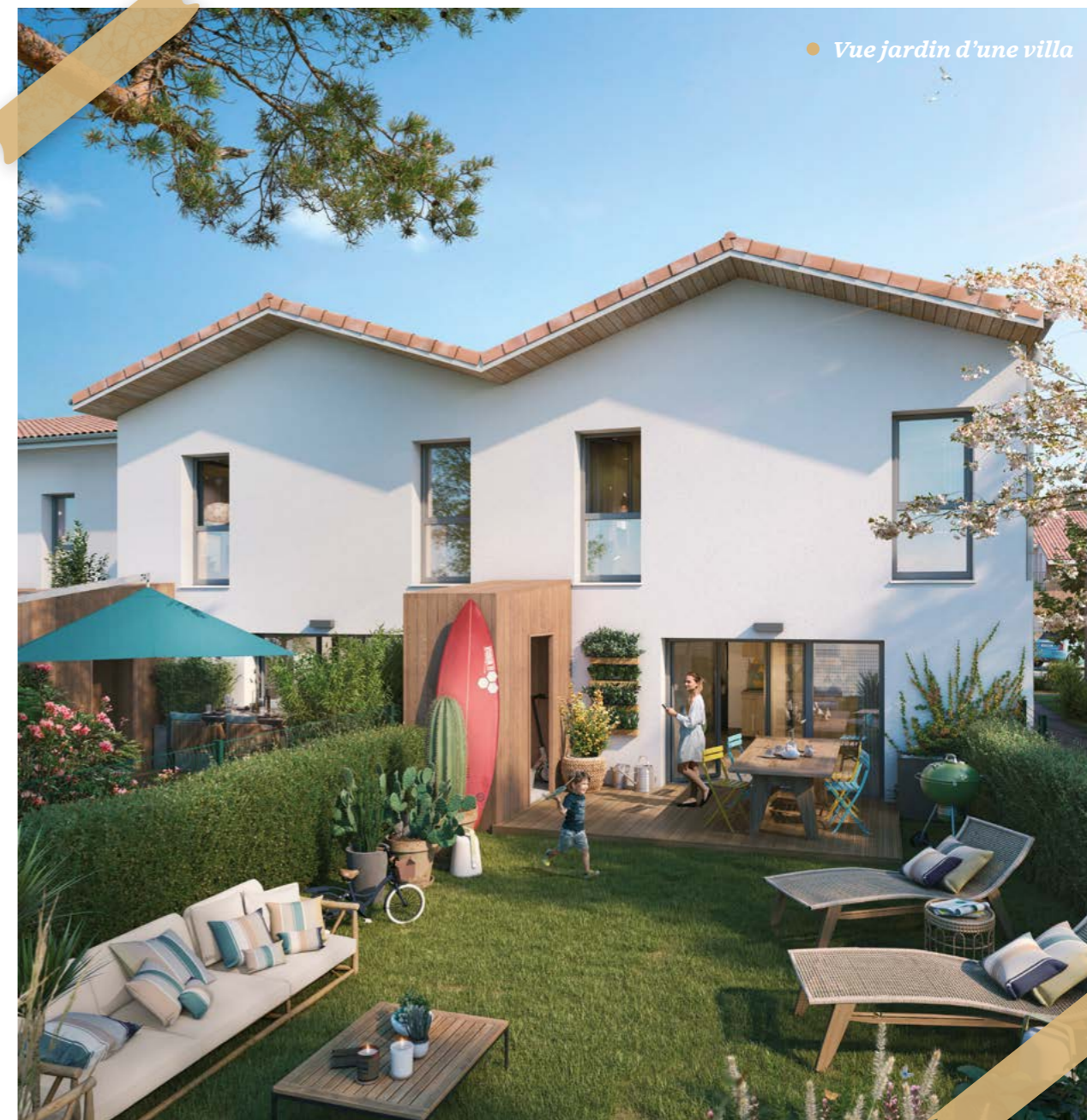
● Vue jardin d'une villa