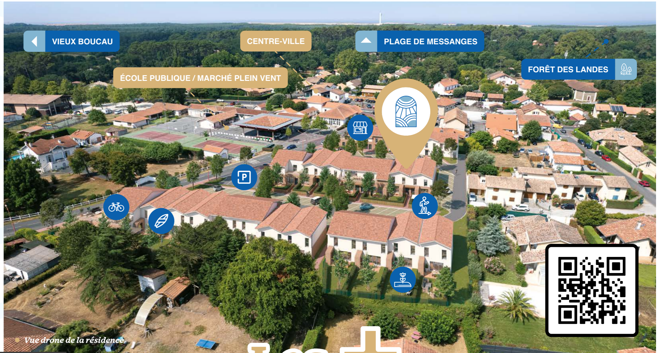
Vue drone de la résidence

La résidence Sporting Hesta est située avenue de la Gemme, dans une zone résidentielle pavillonnaire. Son emplacement idéal, à seulement 2 minutes à pied du centre-ville et de ses Halles, vous offre un cadre de vie préservé en cœur de ville, à proximité immédiate des services publics et des commodités.