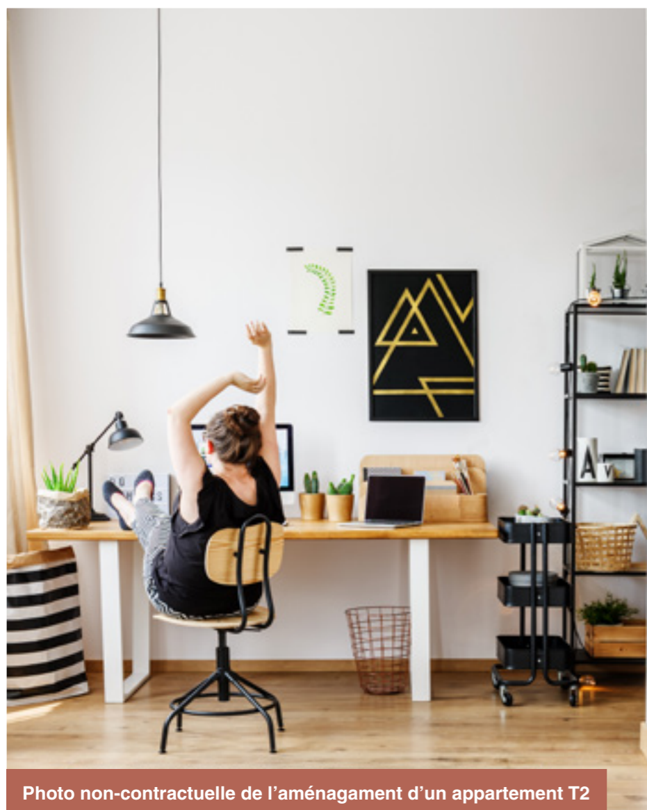
Photo non-contractuelle de l'aménagement d'un appartement T2