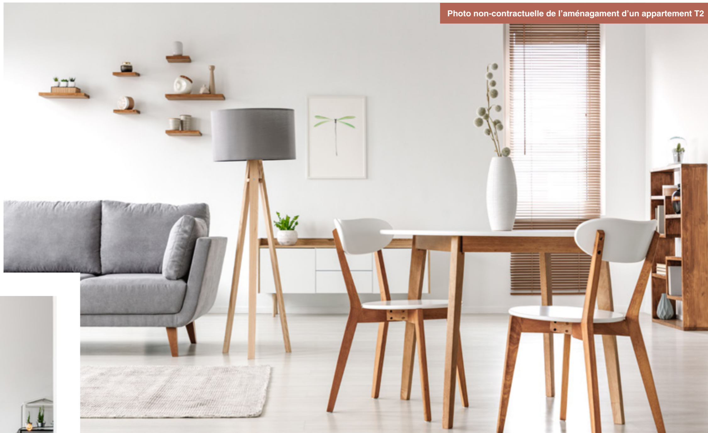
Photo non-contractuelle de l'aménagement d'un appartement T2