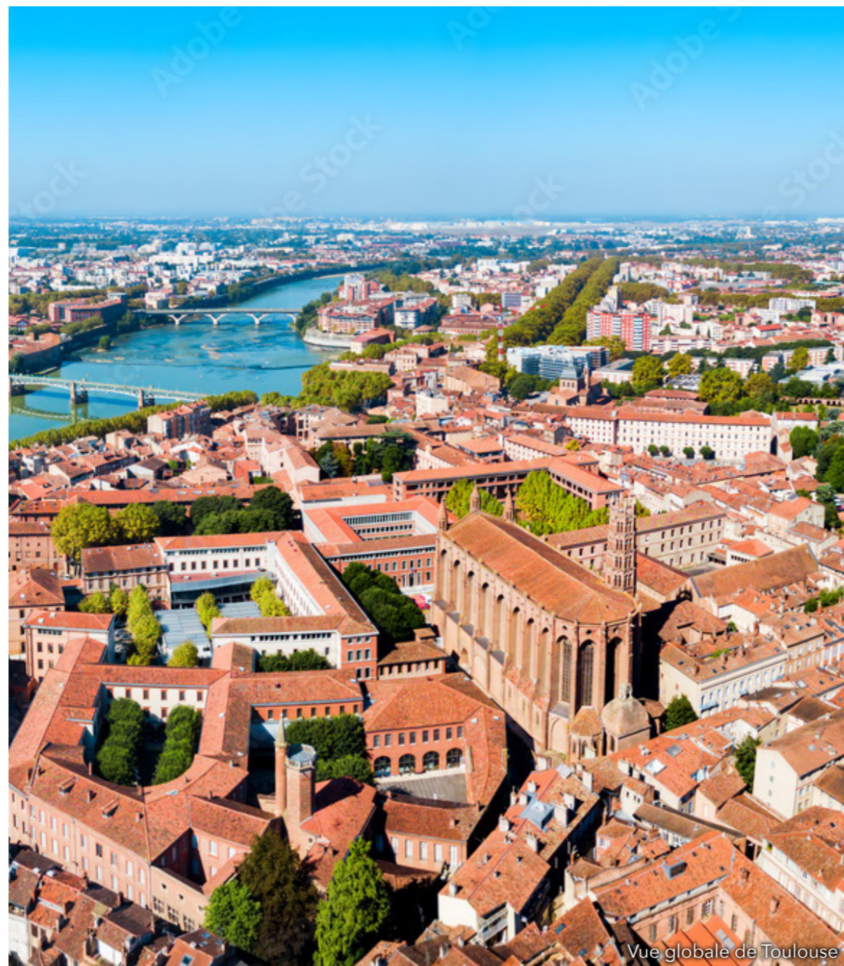
Vue globale de Toulouse

Une ville verte avec 160 parcs et des promenades le long de la Garonne et du Canal du Midi