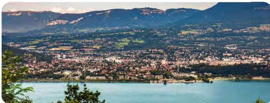
Vue sur le Lac du Bourget et Aix les Bains

Si la commune est aujourd'hui prisée par les amoureux des activités nautiques et de montagne, elle l'est aussi pour son cadre de vie agréable et convivial. Le centre-ville est animé toute l'année grâce aux commerces, services et une programmation culturelle riche et variée. L'été, le festival Musilac s'installe au bord du lac, à l'instar de nombreux évènements temporaires.