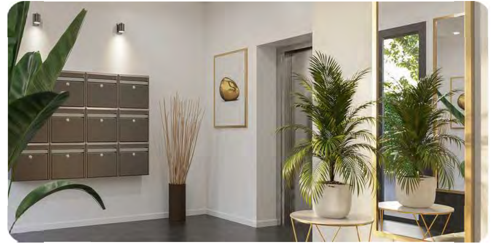
Exemple de hall sécurisé