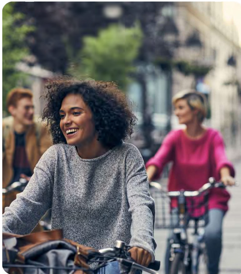
Un cadre de vie privilégié

La Datcha bénéficie d'une situation privilégiée dans un quartier résidentiel d'Aix-les-Bains. Elle prend place à seulement 4 minutes du centre-ville , à deux pas des établissements scolaires et de la gare d'Aix-les-Bains-Le Revard. De nombreux commerces, services, restaurants sont installés à quelques minutes à pied de la résidence, vous garantissant un quotidien pratique et agréable . Pour vos loisirs et promenades , vous pourrez notamment profiter du Bois Vidal avec son belvédère et son parcours sportif.