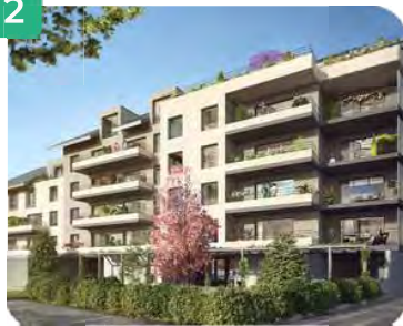
Vue cœur d'îlot