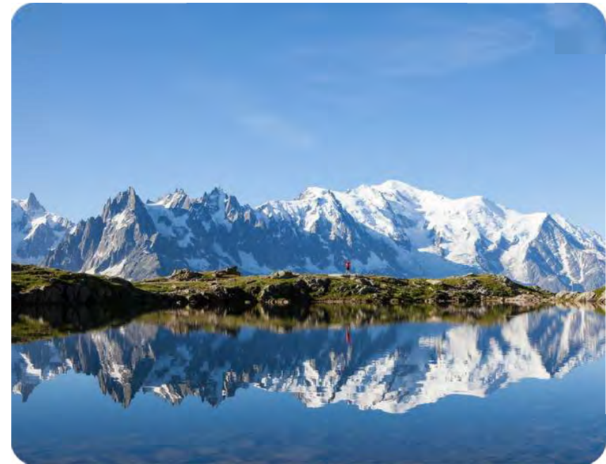
Le massif des Alpes

Synonyme de cimes enneigées, d'immenses forêts et de lacs majestueux , la Savoie abrite des paysages sans équivalent. Réputé pour son environnement naturel préservé , le département propose à ses habitants un cadre de vie parmi les plus attractifs du pays. La Savoie a aussi la chance de se situer au carrefour de métropoles européennes majeures comme Lyon, Grenoble, Genève ou encore Turin . Cette proximité confère au département une excellente dynamique en matière d'économie et d'emploi.