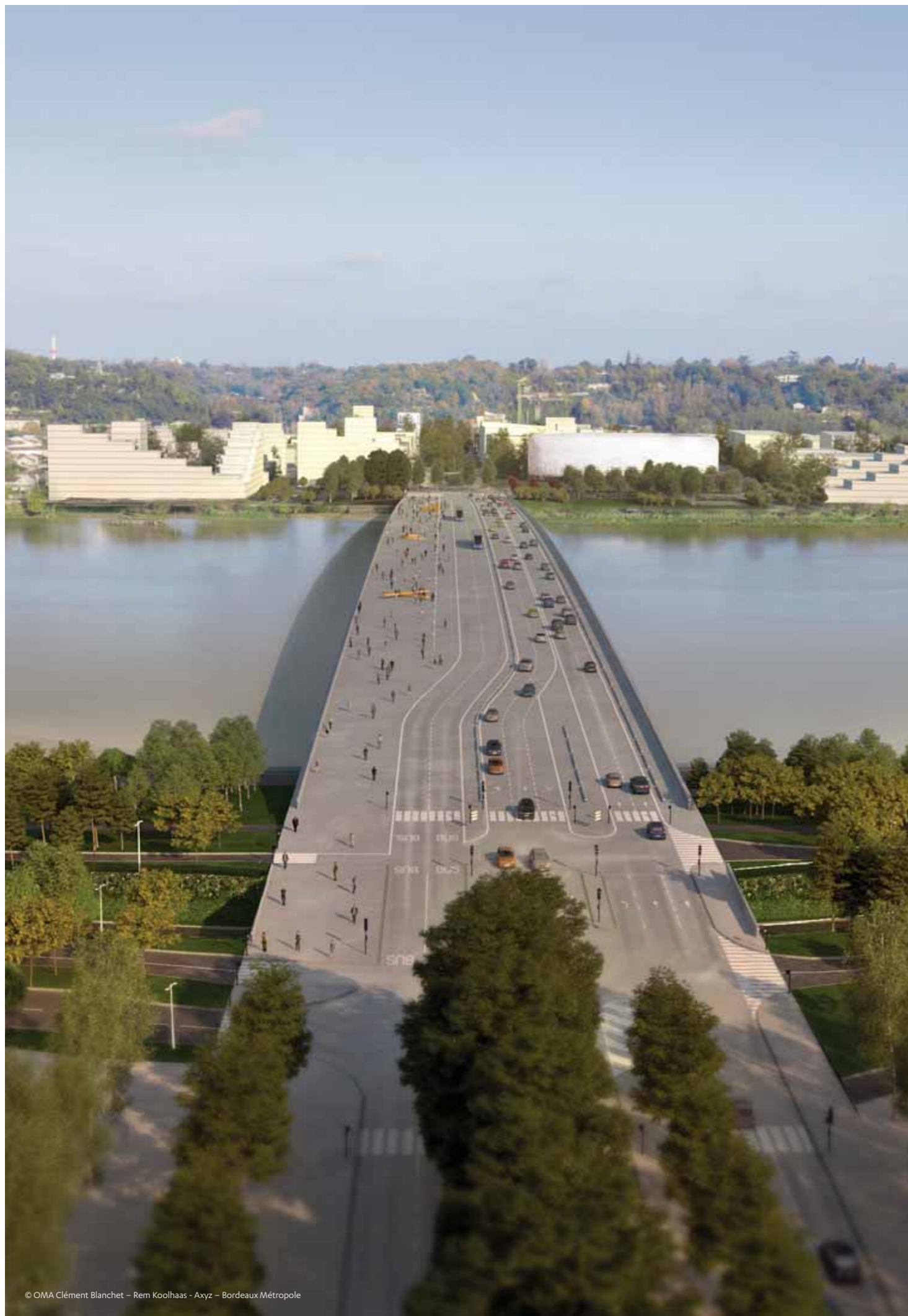
© OMA Clément Blanchet - Rem Koolhaas - Axyz - Bordeaux Métropole