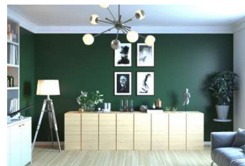
« Design contemporain »