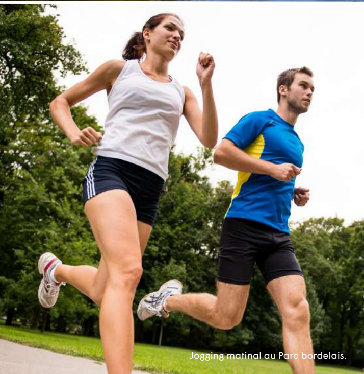
Jogging matinal au Parc bordelais.