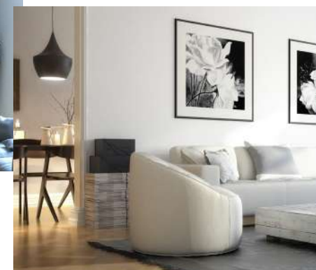
« Classique chic »