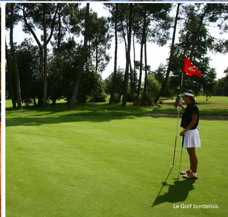
Le Golf bordelais.