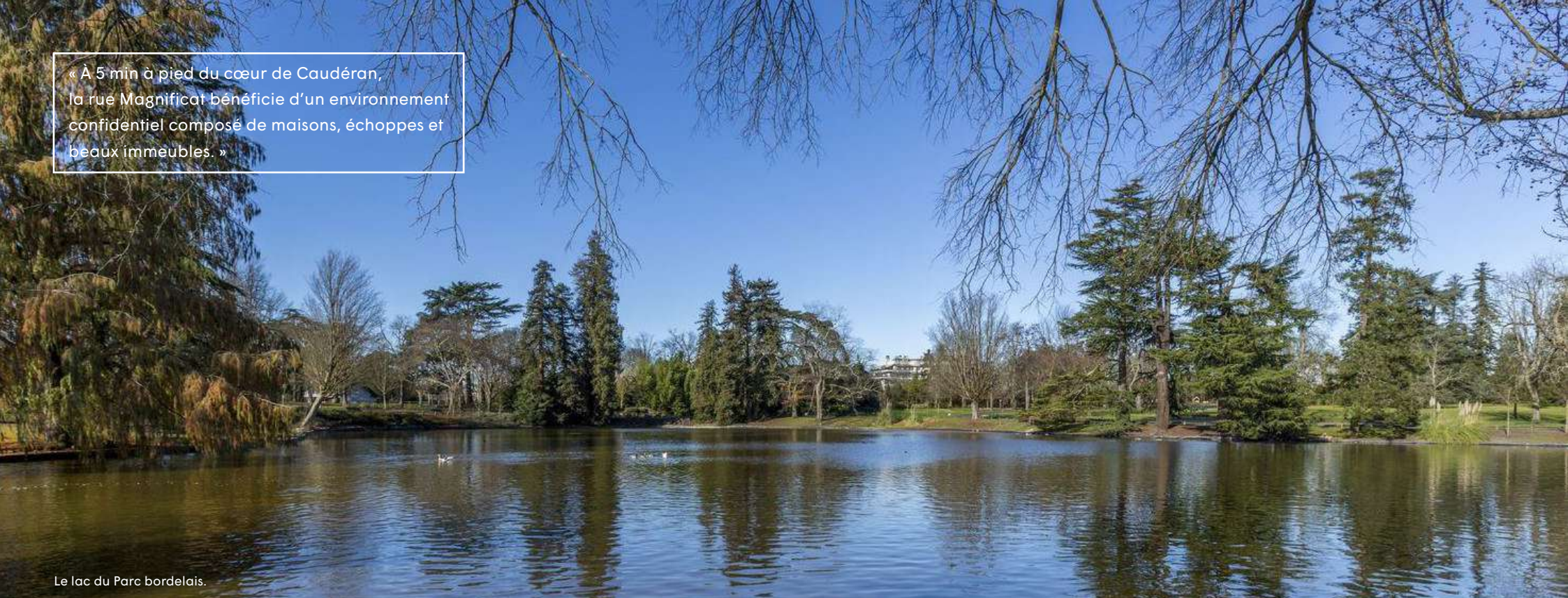
Le lac du Parc bordelais.

« À 5 min à pied du cœur de Cauderan, la rue Magnificat bénéficie d'un environnement confidentiel composé de maisons, échoppes et beaux immeubles. »