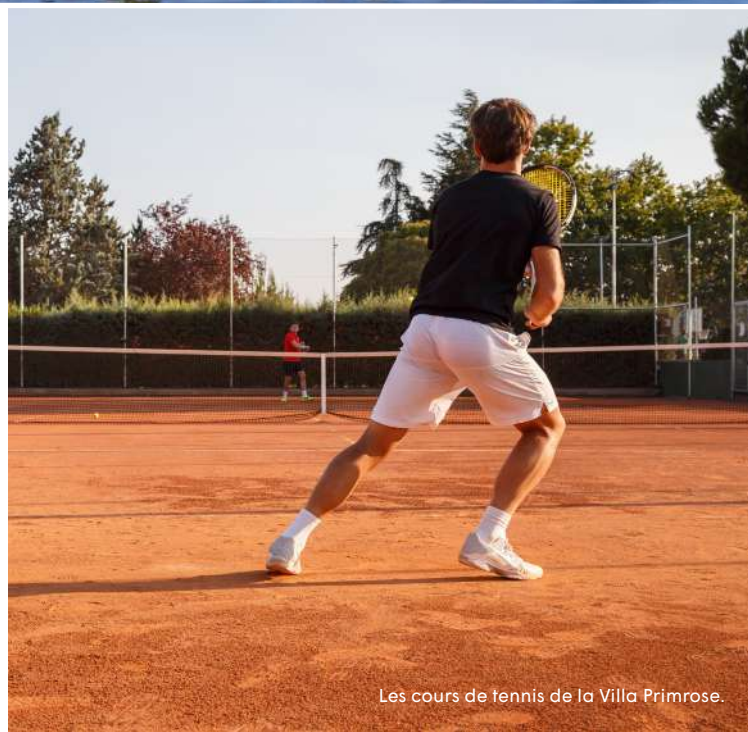
Les cours de tennis de la Villa Primrose.