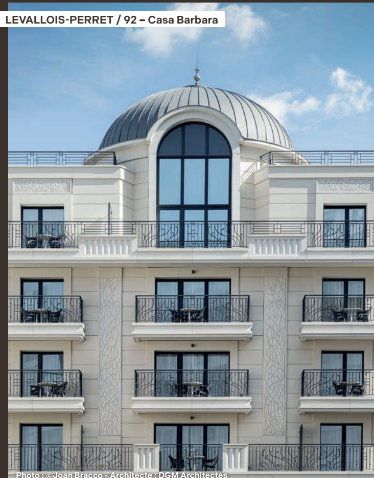
LEVALLOIS-PERRET / 92 – Casa Barbara