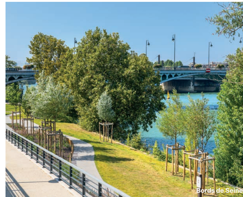
Bords de Seine