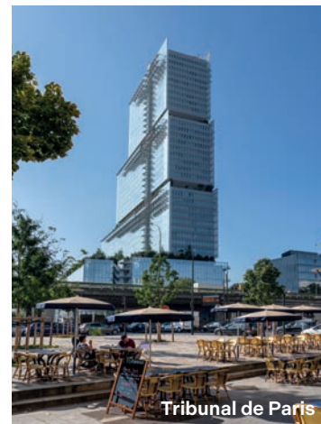
Tribunal de Paris