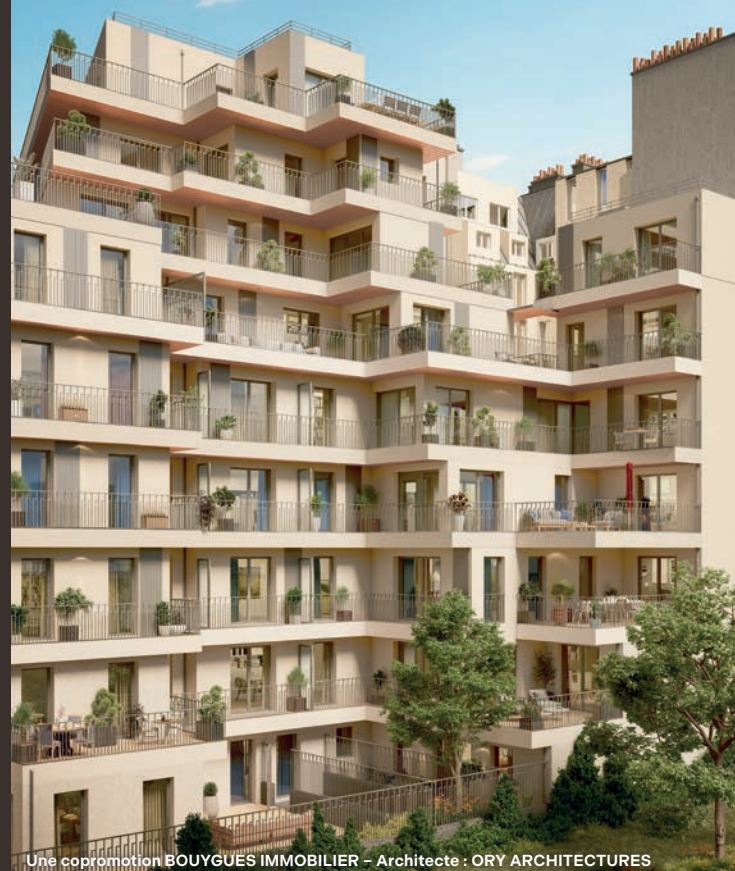
NEUILLY-SUR-SEINE / 92 – Galerie Peretti