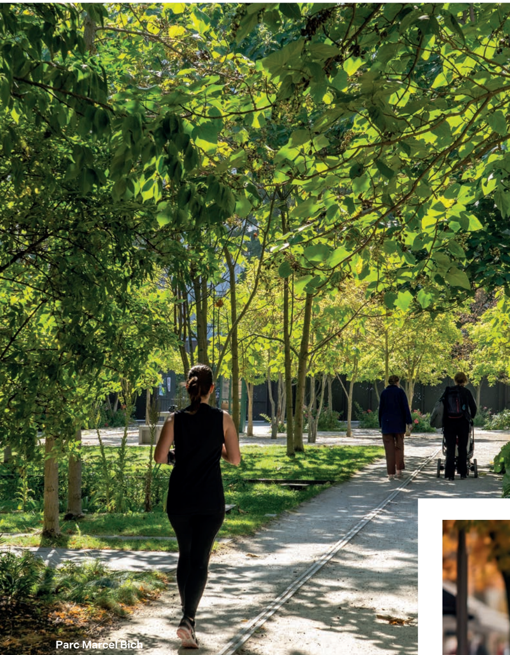
Parc Marcel Bich