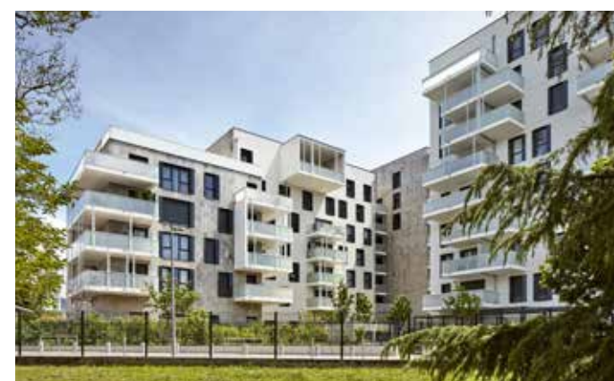
Les terrasses de l'Helvétie - Ambilly Architecte : Cabinet Oworkshop