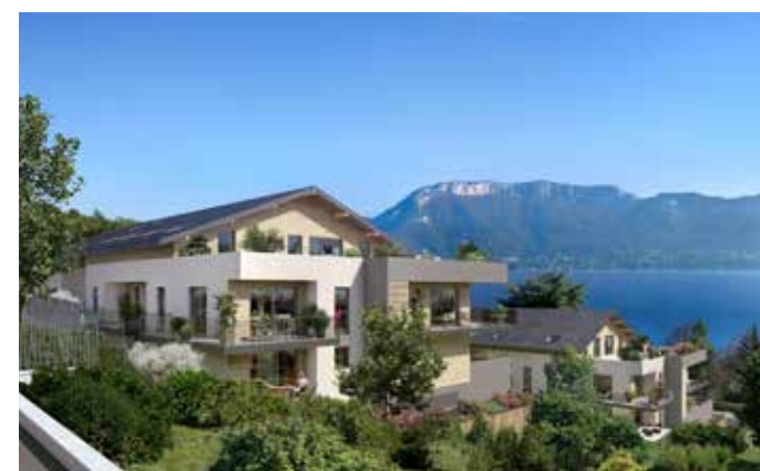
Les terrasses du lac - Sévrier Architecte : David Ferré