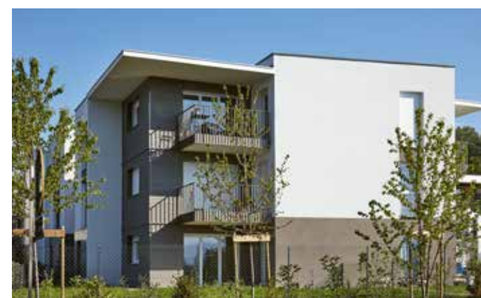
Les Hauts du Lac - Anthy-sur-Léman Architecte : David Ferré