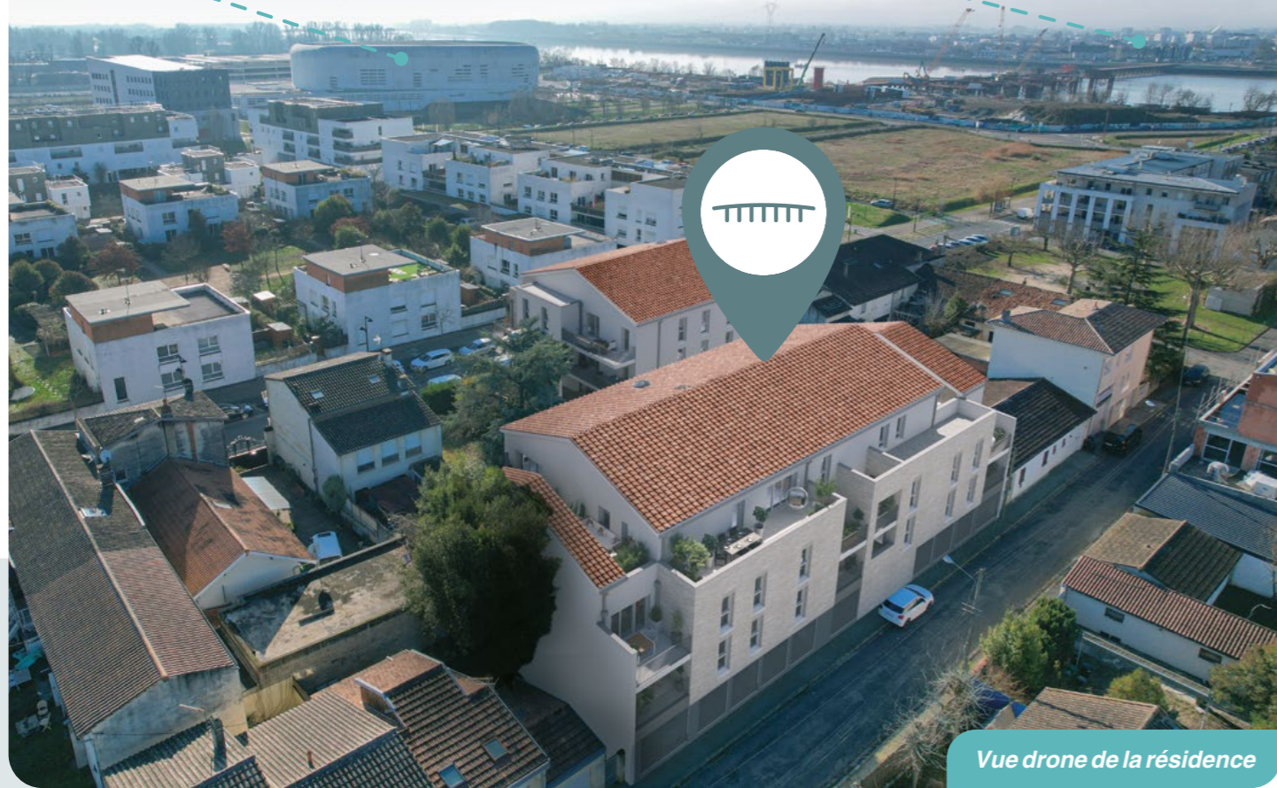
Vue drone de la résidence