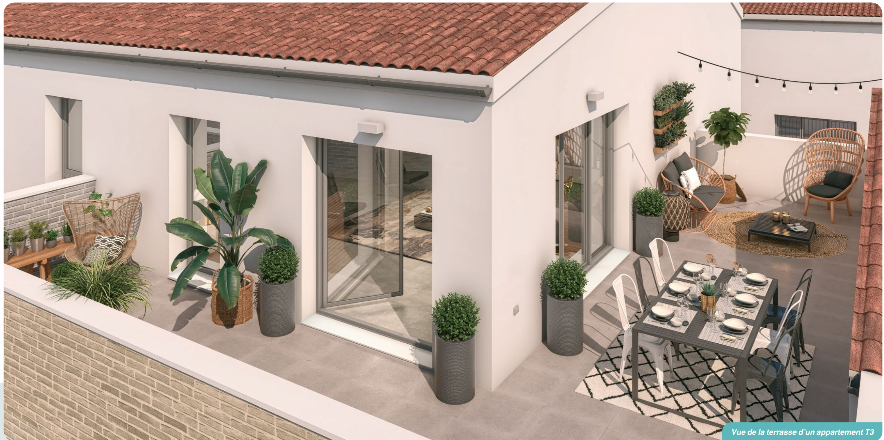
Vue de la terrasse d'un appartement T3