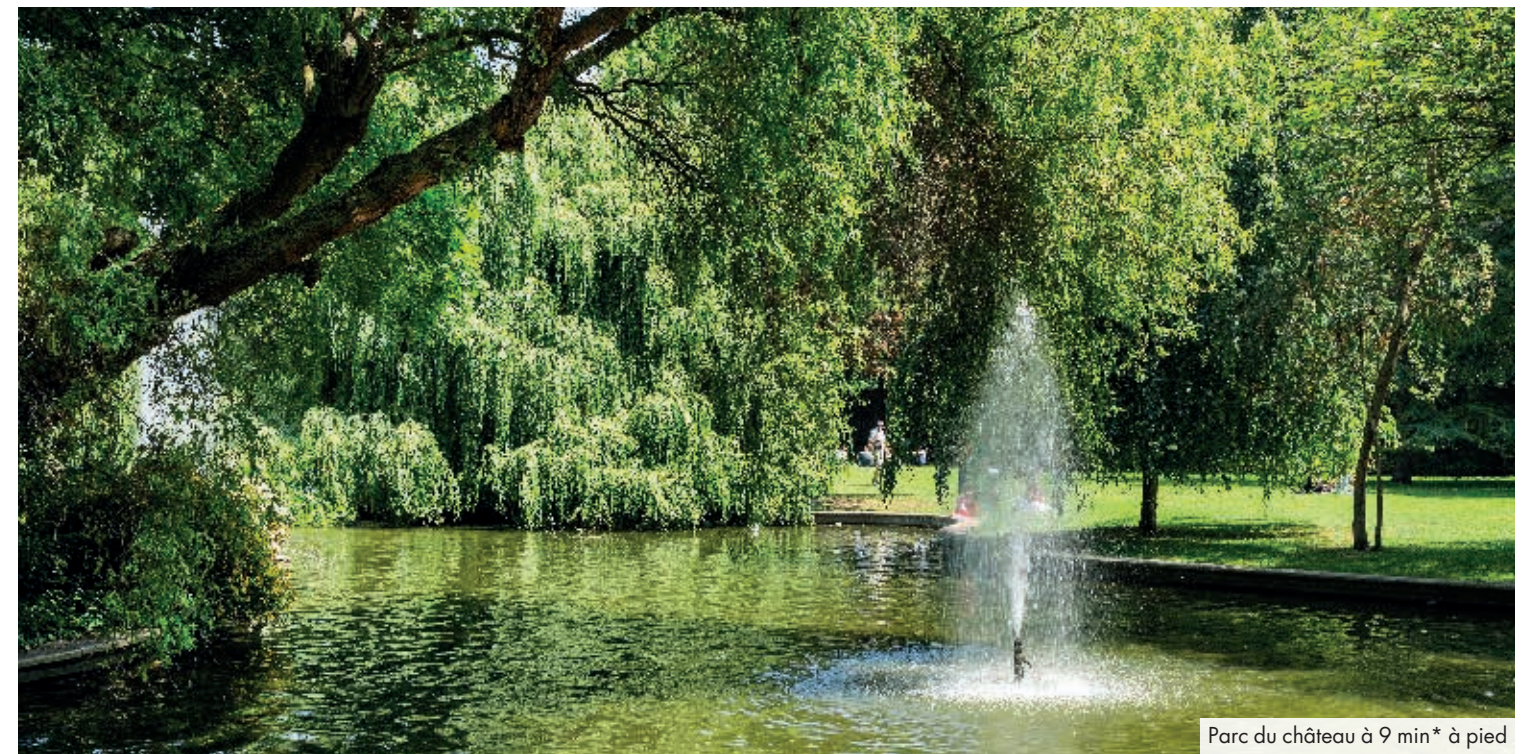
Parc du château à 9 min* à pied