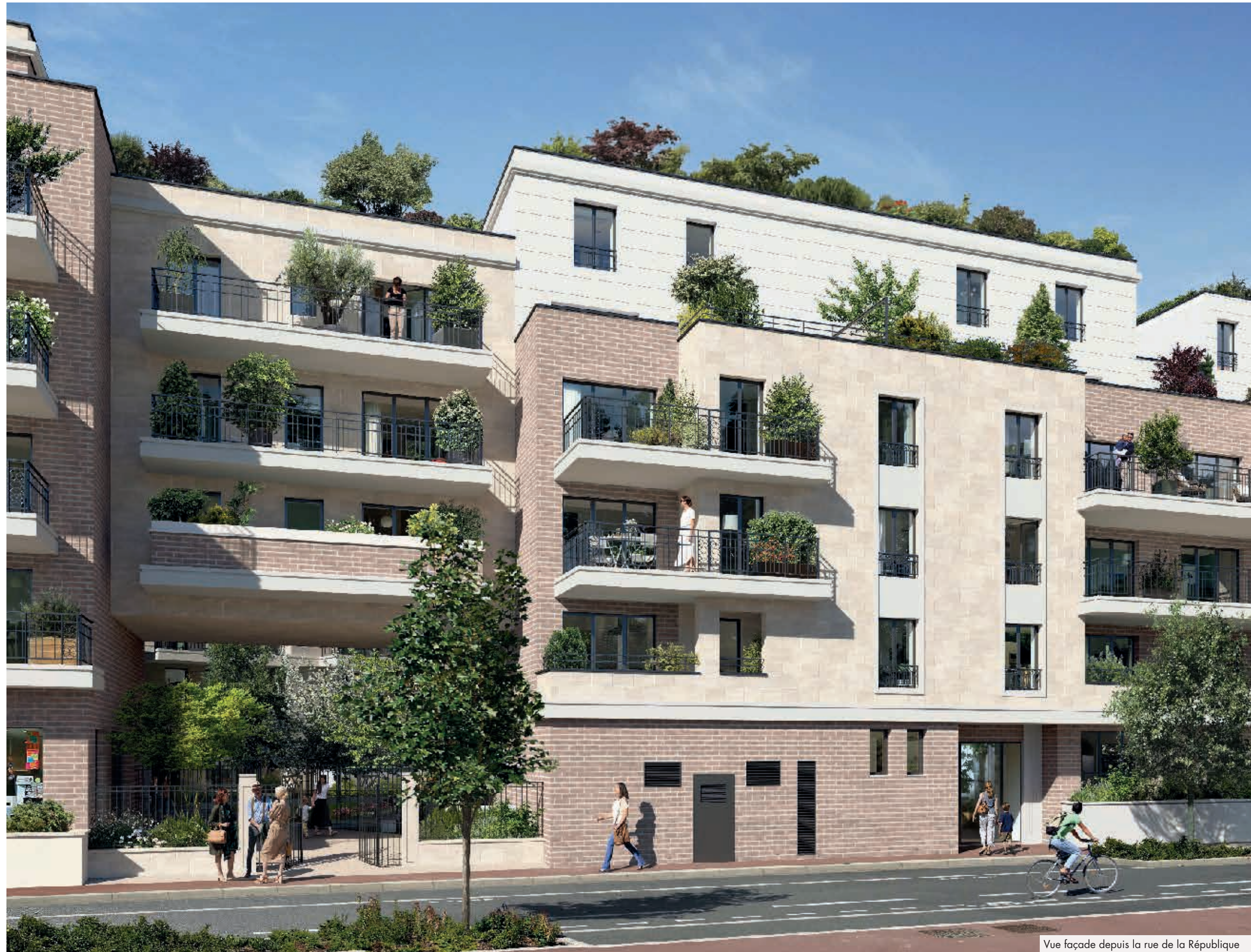
Vue façade depuis la rue de la République