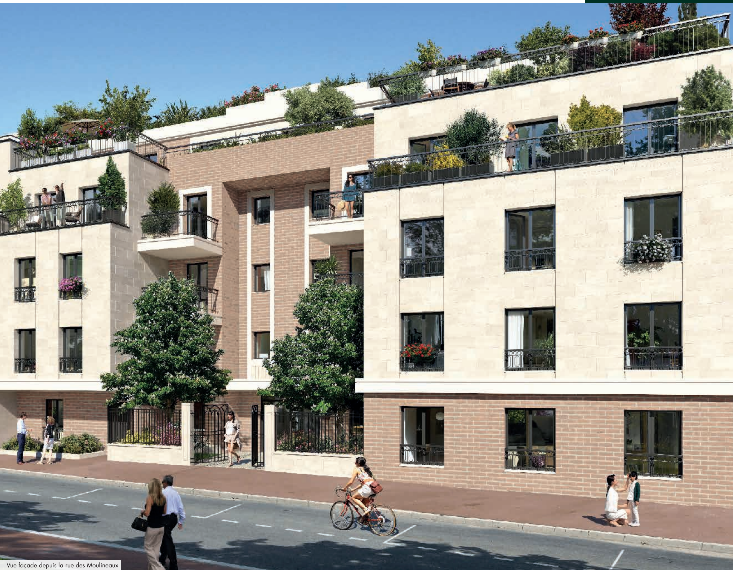
Vue façade depuis la rue des Moulineaux