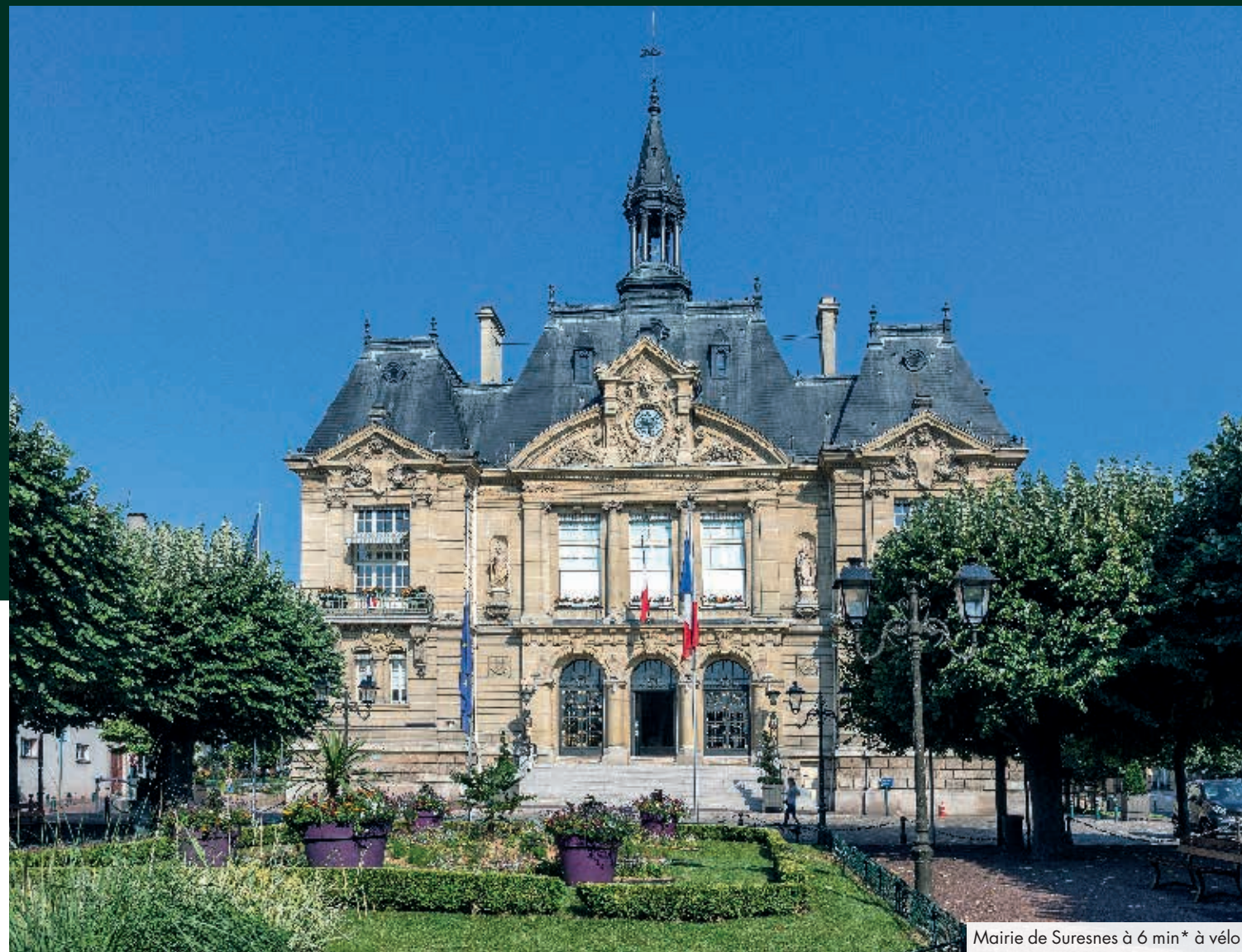
Mairie de Suresnes à 6 min* à vélo