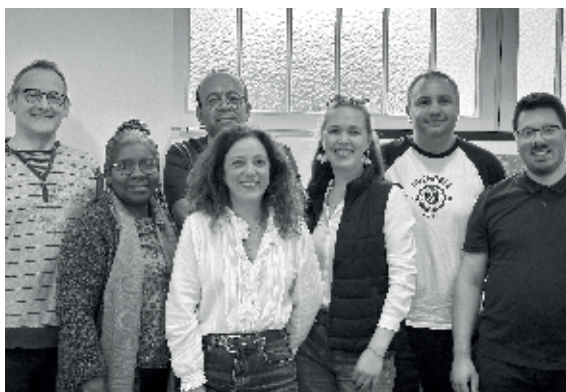
Cabinet François de Alexandris – Architecte

Les façades sont généreusement ornementées. Le travail de la pierre, de la brique et du béton est mis en lumière dans une composition élégante et contemporaine. Les modénatures sculptées soulignent le style architectural et apportent une touche de sophistication à l'ensemble. Cette attention portée aux détails des façades se prolonge à l'intérieur, avec des finitions soignées et des aménagements fonctionnels offrant un cadre de vie alliant modernité et bien-être. Des rooftops avec vue sur le Bois de Boulogne et Paris ont été aménagés en toiture-terrasse.