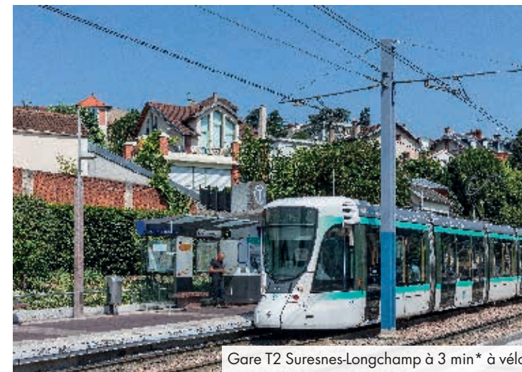
Gare T2 Suresnes-Longchamp à 3 min* à vélo