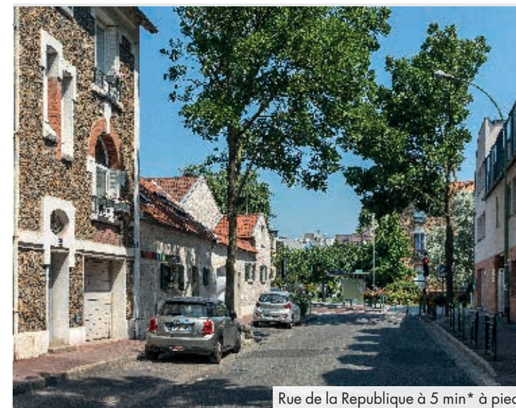
Rue de la République à 5 min* à pied