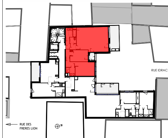
Apt N°02 - T3 Privilage - Etage 1 - EVOLUTIF