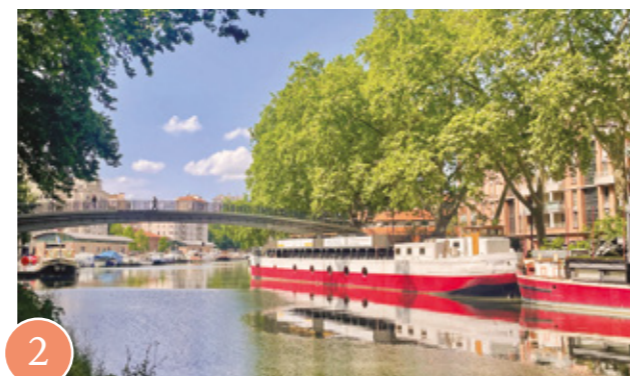
2 Canal du Midi, patrimoine mondial de l'UNESCO