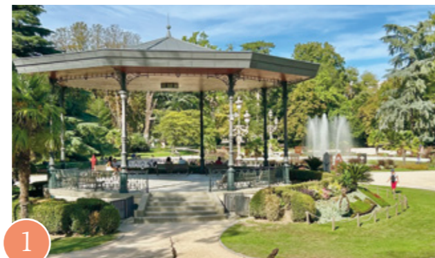
1 Jardin du Grand Rond

Le Jardin des Plantes et le Muséum d'Histoire Naturel offrent aux résidents des refuges verdoyants et atypiques.