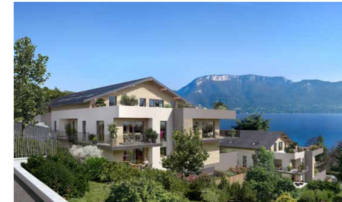
Les terrasses du lac à Sévrier Architecte : David Ferré