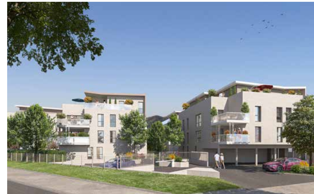
L'Orée du Lac à Sciez Architecte : Agence Oworkshop