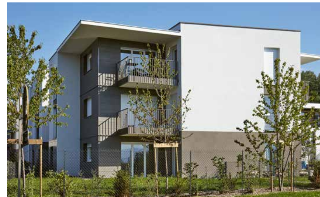
Les Hauts du Lac à Anthy-sur-Léman Architecte : David Ferré