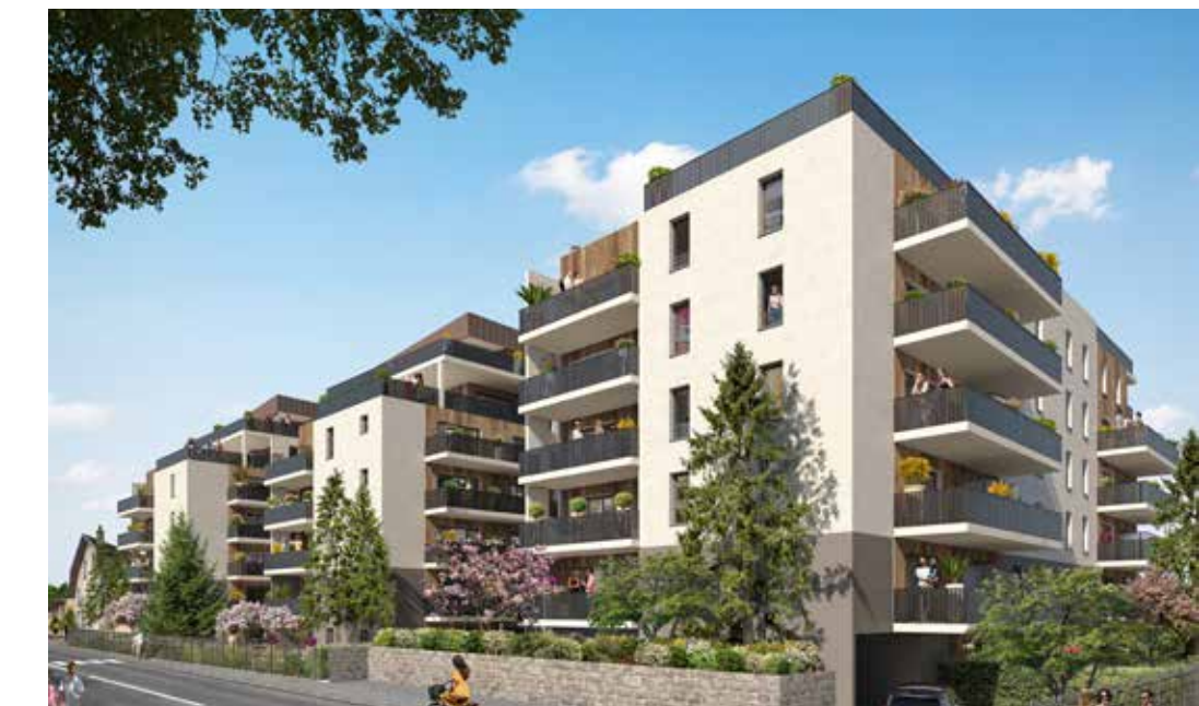
Le Belvédère du Léman à Thonon-les-Bains Architecte : Chambre & Vibert