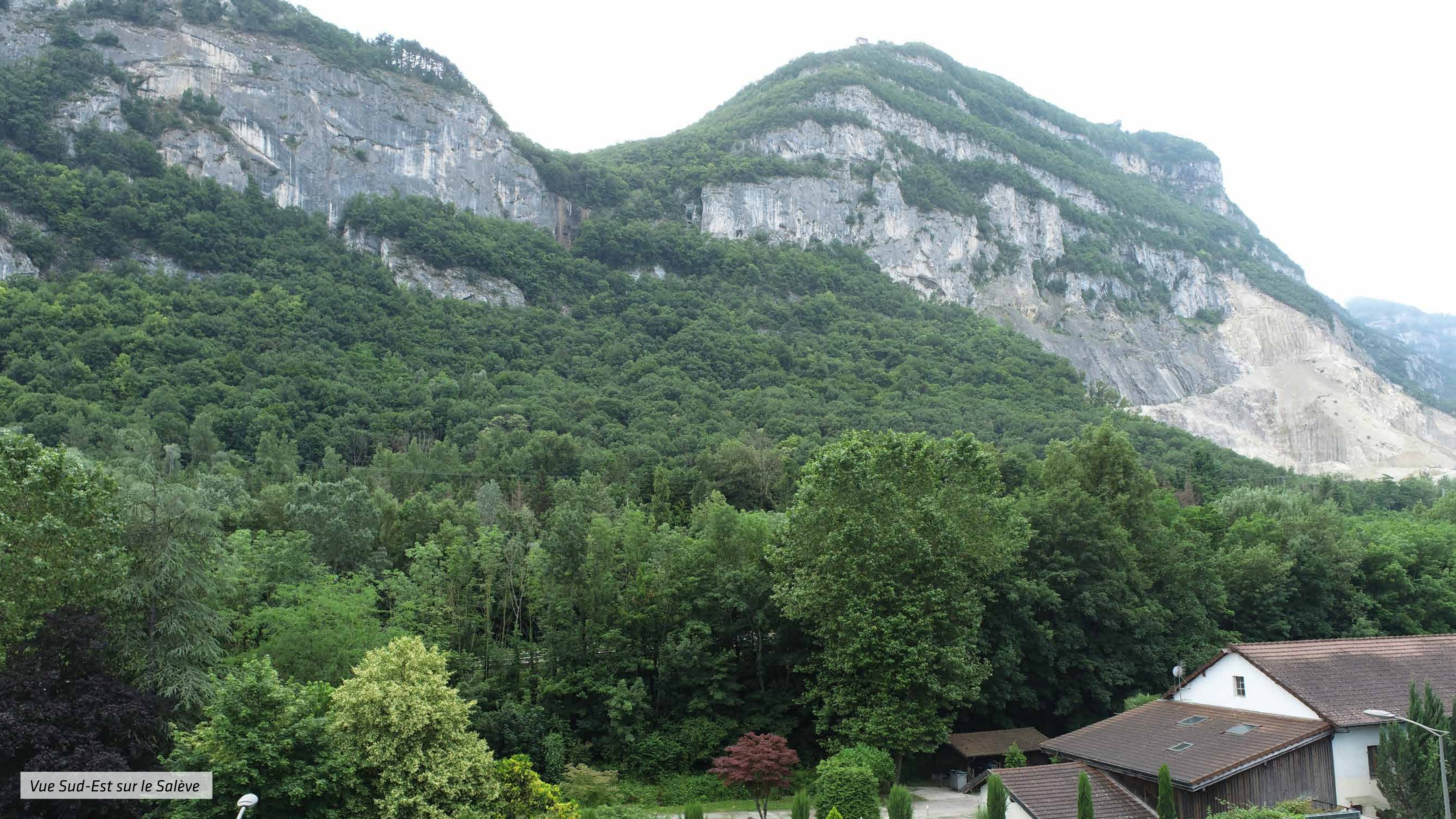
Vue Sud-Est sur le Salève