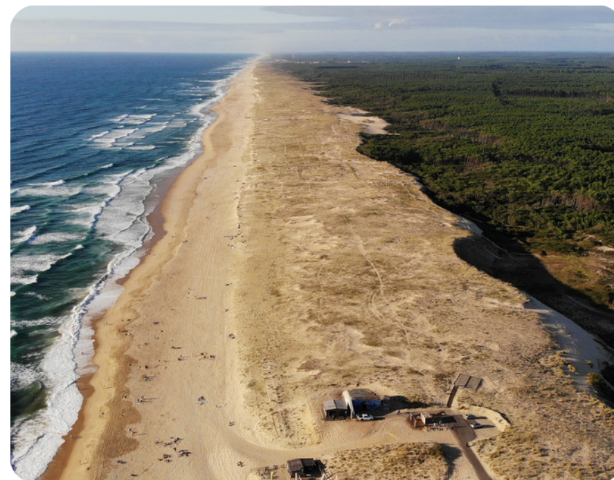
Plage des Landes

Premier département thermal de France , les Landes comptent près de 19 établissements thermaux accueillant plus de 80 000 curistes chaque année. Mais si l'économie du deuxième plus grand département français repose pour beaucoup sur le tourisme , elle tire également son dynamisme de l'industrie, de l'agriculture et de la filière bois . Qualité de vie et opportunités, bienvenue dans les Landes !