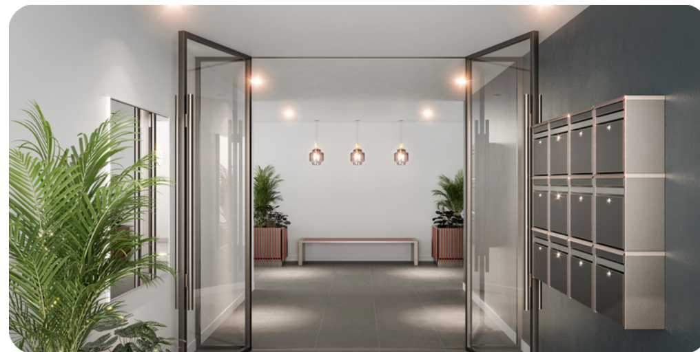
Exemple de hall sécurisé

24, place de la Pépinière 40130 Capbreton