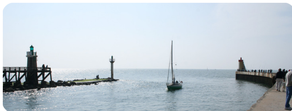
Entrée du port de Capbreton

Si l' économie de Capbreton est très orientée vers le tourisme (balnéothérapie, hôtellerie, camping), la ville possède un solide tissu diversifié. La ZAC des 2 Pins accueille artisans, commerçants et professionnels de la santé ainsi que des lieux de vie et d'activités. Les marchés, annuels ou estivaux, permettent de mettre en avant des producteurs locaux. La proximité à Dax, Biarritz et Bayonne place également la commune dans un territoire dynamique et attractif .