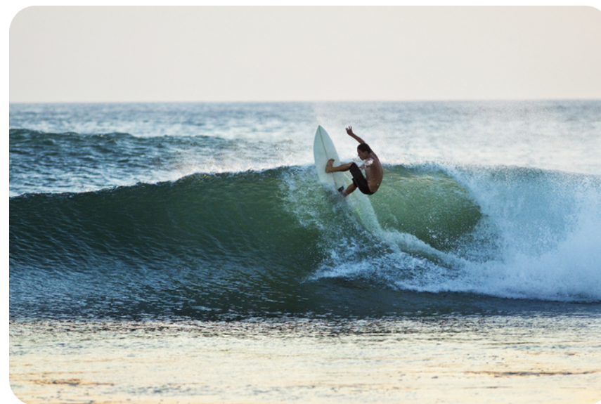
Paradis des sports nautiques

Station balnéaire parmi les plus réputées de la côte Atlantique, Capbreton est particulièrement appréciée des amoureux de sports nautiques et de glisse . Si à l'ouest, la ville se tourne vers l' océan , elle retrouve plus de verdure à l'est, ce qui en fait une ville idéale pour effectuer de nombreuses activités de plein air . Avec 27 kilomètres de pistes cyclables, 11 kilomètres de voie verte, 9 kilomètres de sentiers pédestres et 6 kilomètres de littoral, la commune offre une qualité de vie recherchée !