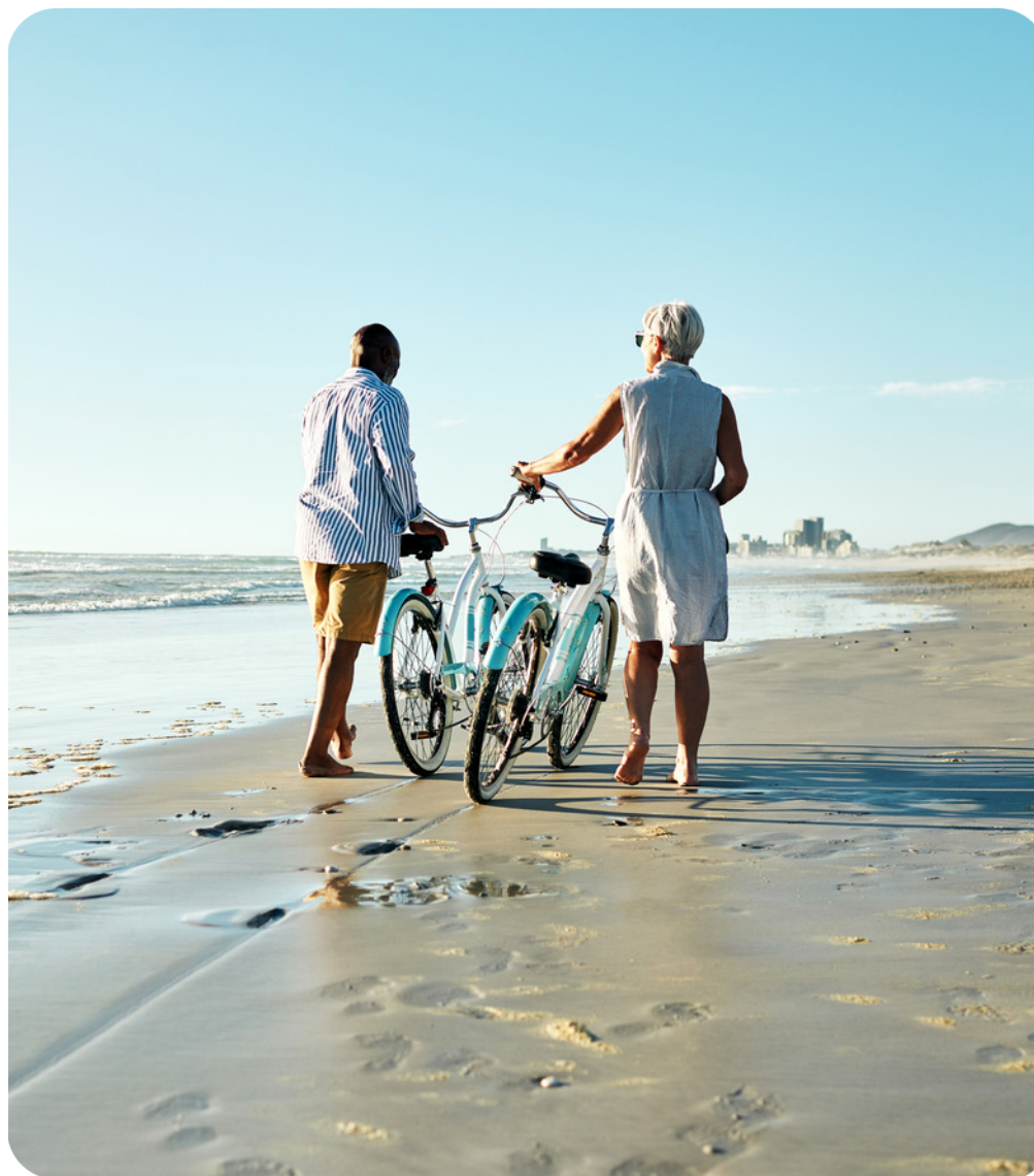
Une vie entre ville et nature

Une ligne de bus se trouve au pied de la résidence et vous permet de rejoindre les gares de Labenne ou Saint-Vincent-de-Tyrosse . Plusieurs départementales (D152, D28 ou D652) vous permettent de rejoindre l'A63 ou des pôles d'activité alentours. Conjuguant calme et accessibilité, le Domaine Saint-Nicolas est une résidence de choix pour réaliser son projet immobilier.