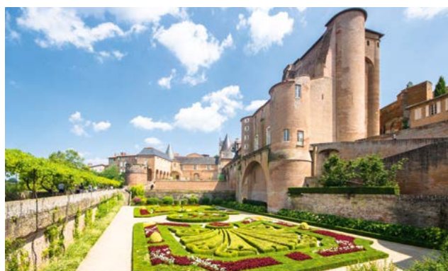
Jardins du Palais