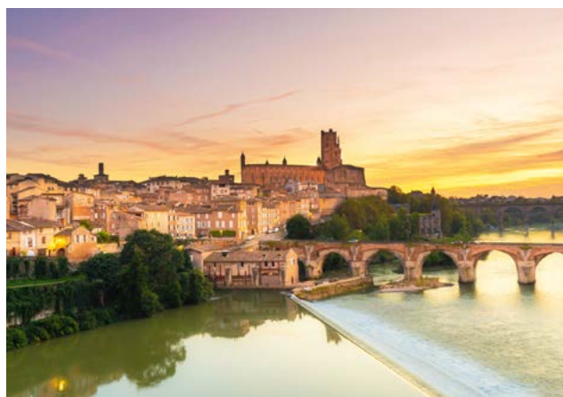
Vue cathédrale Sainte-Cécile

La salle de spectacles de Pratgraussals, à deux pas de la résidence, affiche tout au long de l'année une programmation culturelle riche, comme le célèbre festival Pause-Guitare.