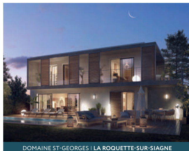
DOMAINE ST-GEORGES | LA ROQUETTE-SUR-SIAGNE