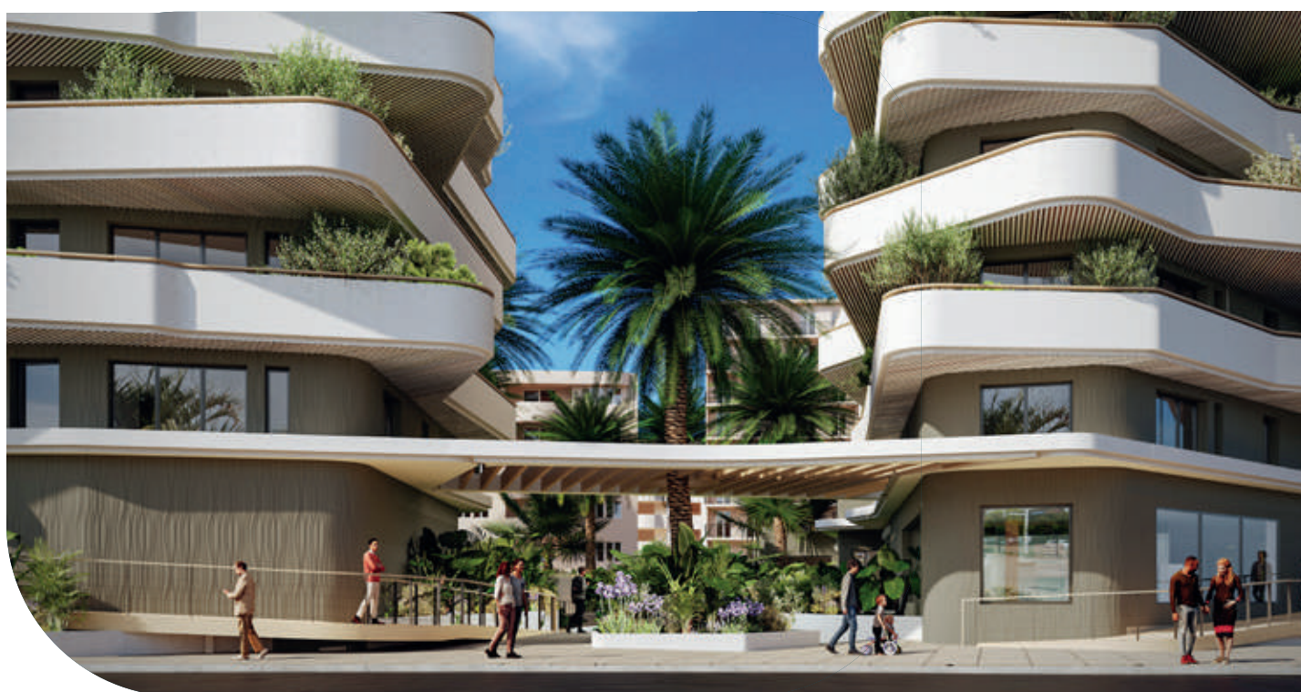
L'entrée de la résidence et sa majestueuse casquette ajourée