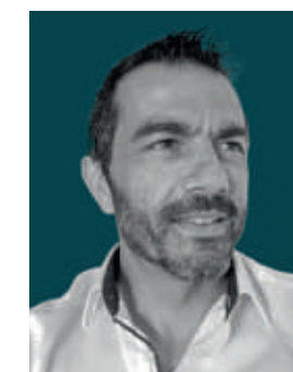
Pascal MARTINO ATELIER MARTINO ARCHITECTURE