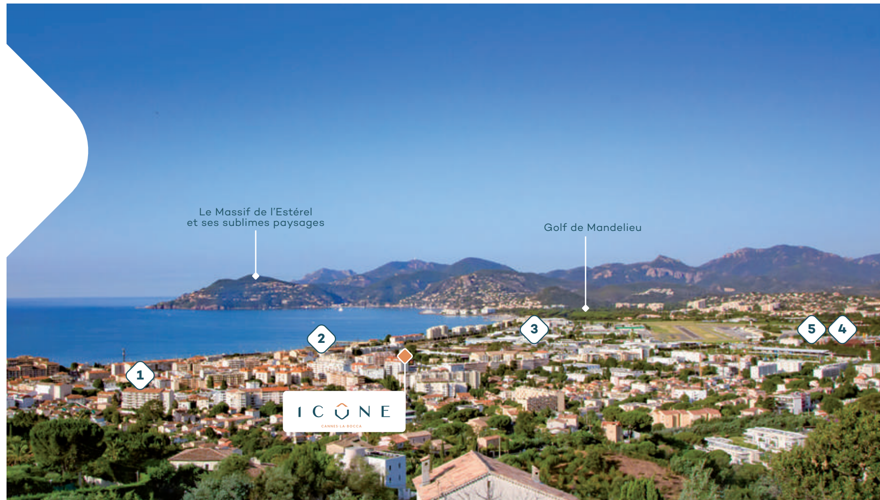
Le Massif de l'Estérel et ses sublimes paysages