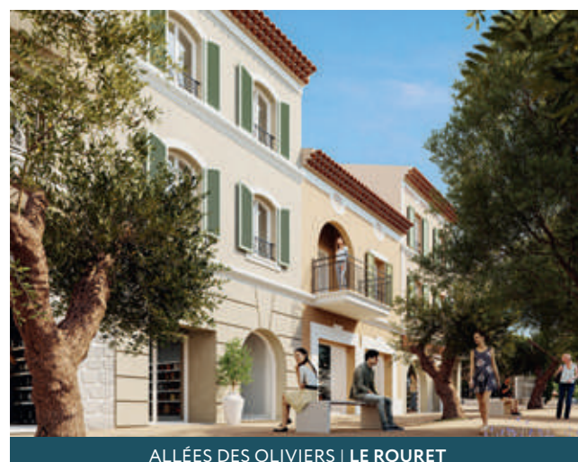
ALLÉES DES OLIVIERS | LE ROURET