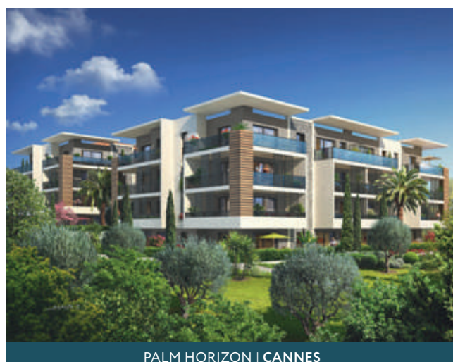
PALM HORIZON | CANNES