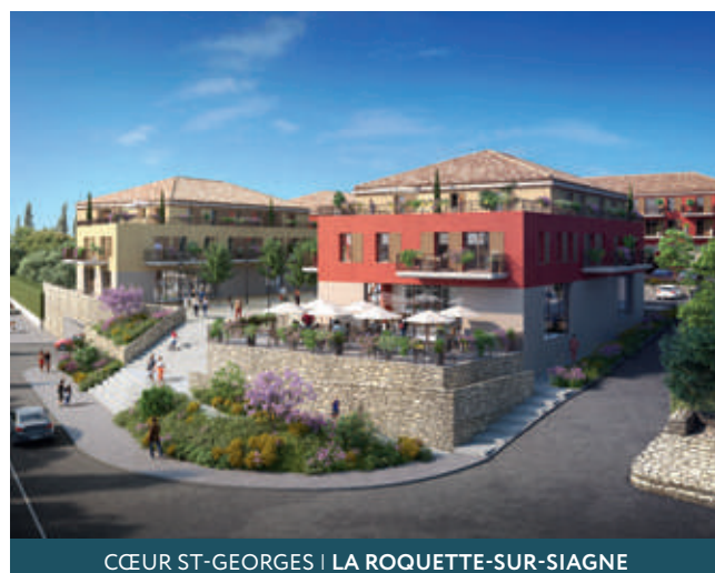
CŒUR ST-GEORGES | LA ROQUETTE-SUR-SIAGNE