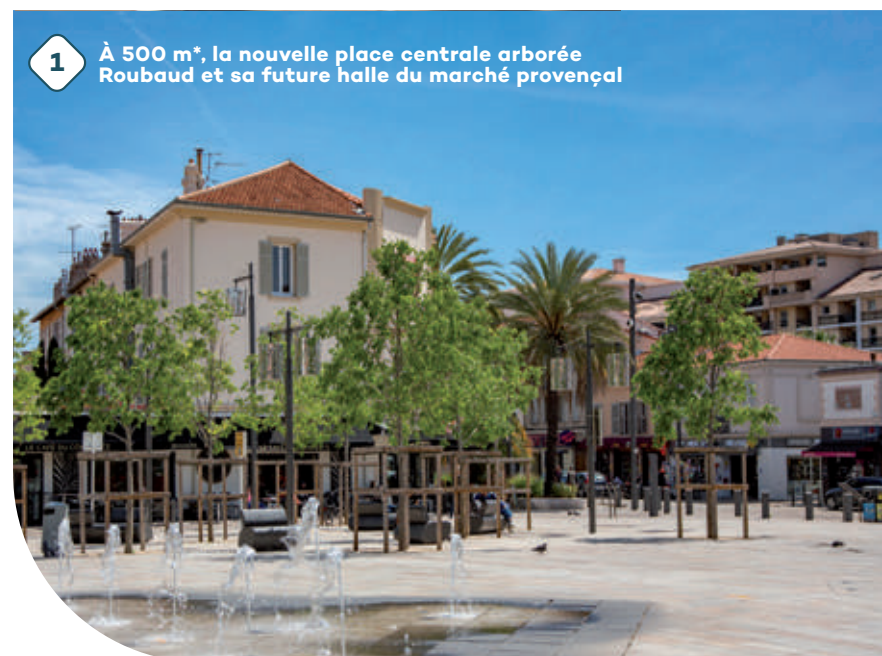
1 À 500 m*, la nouvelle place centrale arborée Roubaud et sa future halle du marché provençal