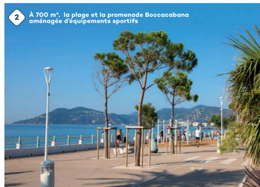
2 À 700 m*, la plage et la promenade Boccabana aménagée d'équipements sportifs