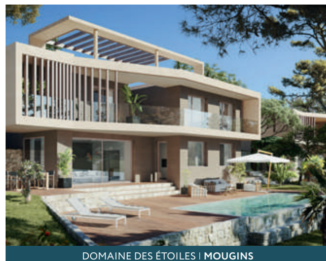
DOMAINE DES ÉTOILES | MOUGINS