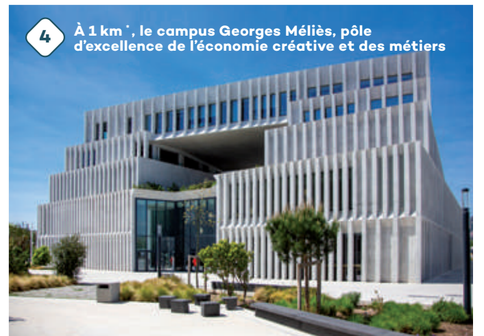
4 À 1 km*, le campus Georges Méliès, pôle d'excellence de l'économie créative et des métiers