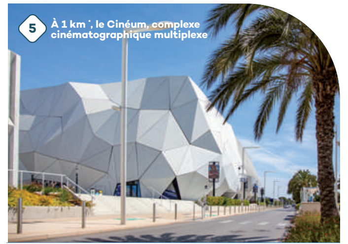
5 À 1 km*, le Cinéum, complexe cinématographique multiplexe