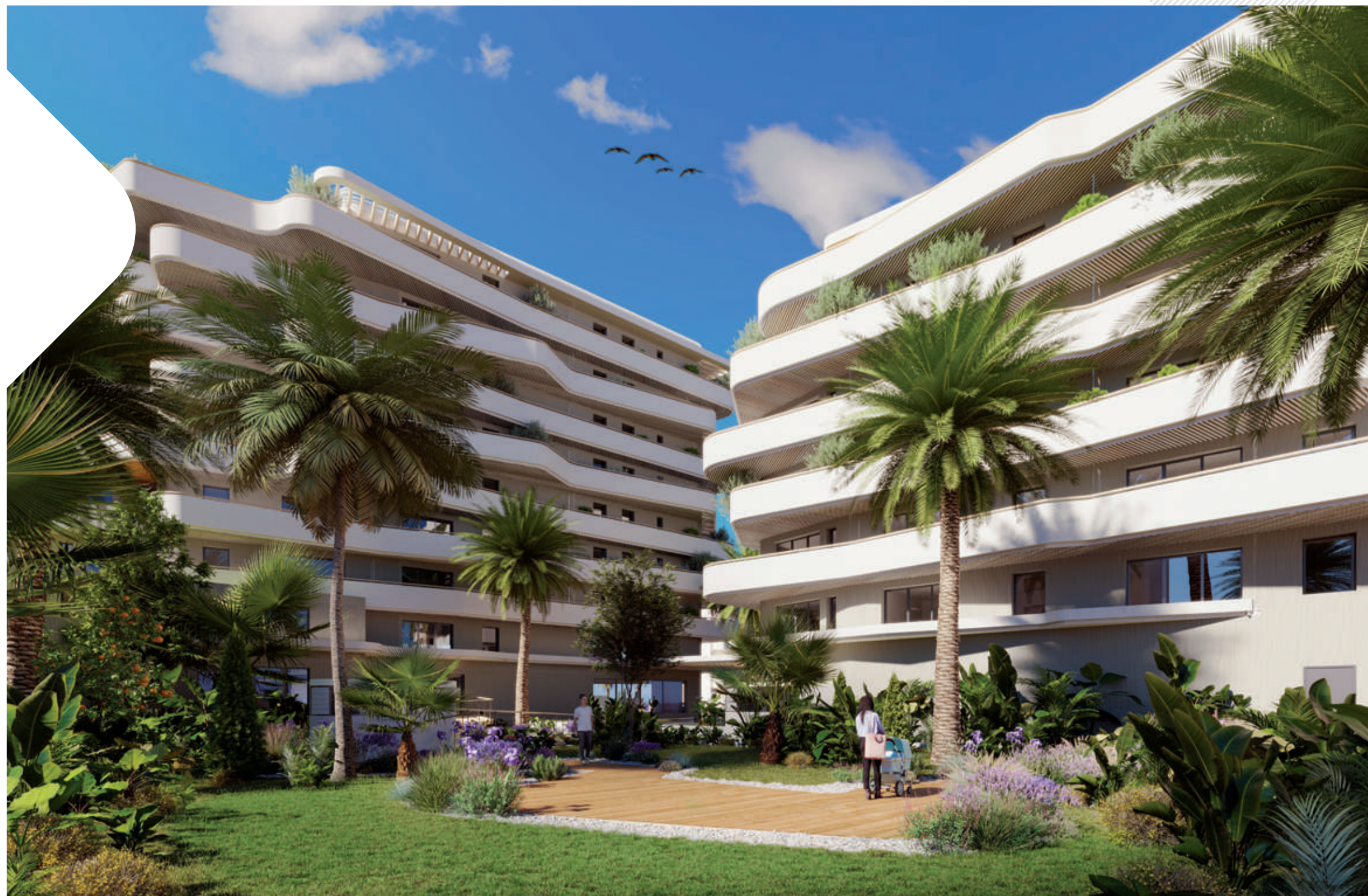
Le cœur d'îlot paysager

Déliçats et aériens, les étages se parent de jardinières végétalisées invitant la nature à rythmer l'ensemble tel un véritable paysage où la végétation dialogue avec le bâti en toute harmonie.