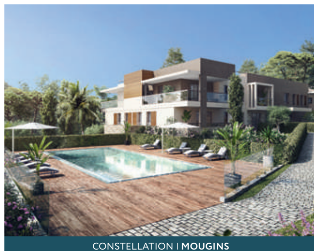
CONSTELLATION | MOUGINS