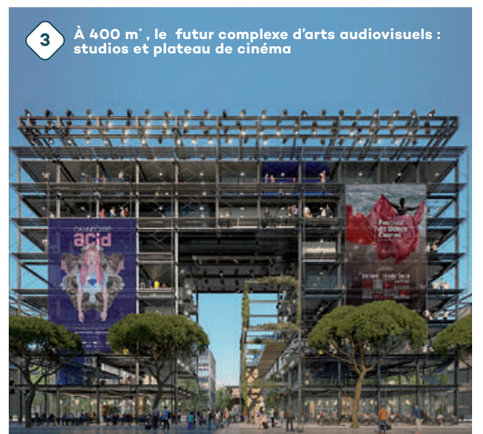
3 À 400 m*, le futur complexe d'arts audiovisuels : studios et plateau de cinéma