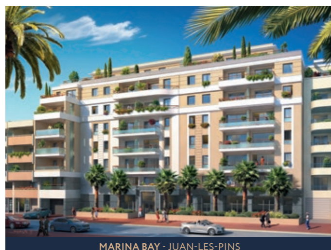
MARINA BAY - JUAN-LES-PINS