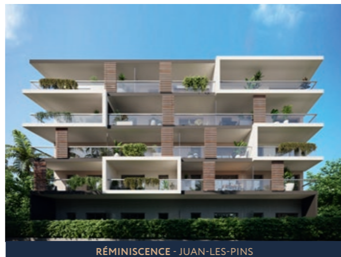
RÉMINISCENCE - JUAN-LES-PINS