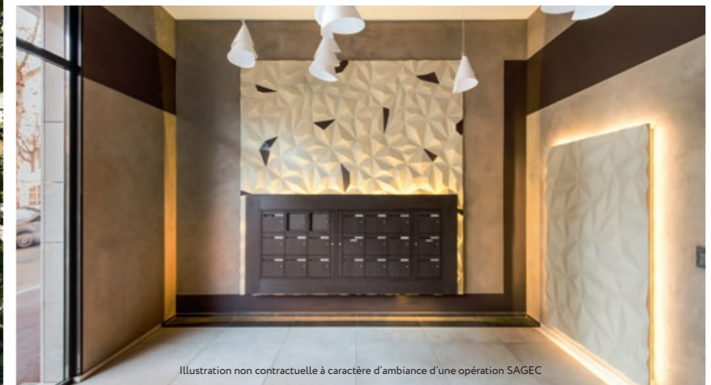
Illustration non contractuelle à caractère d'ambiance d'une opération SAGEC

Imaginé par notre architecte d'intérieur, deux halls d'entrée côté rue, desservent la résidence. Ils allient l'élégance des couleurs et le choix des matériaux afin de créer une ambiance apaisante que vous aurez plaisir à retrouver chaque jour. Le même raffinement se prolonge au sein des paliers d'étage, qui reprennent les mêmes codes et couleurs pour incarner l'identité esthétique de Cap-Lérins.