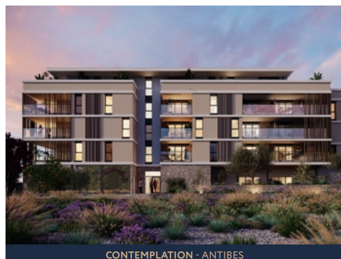
CONTEMPLATION - ANTIBES