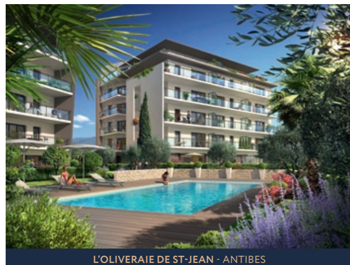
L'OLIVERAIE DE ST-JEAN - ANTIBES