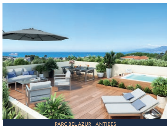
PARC BEL AZUR - ANTIBES