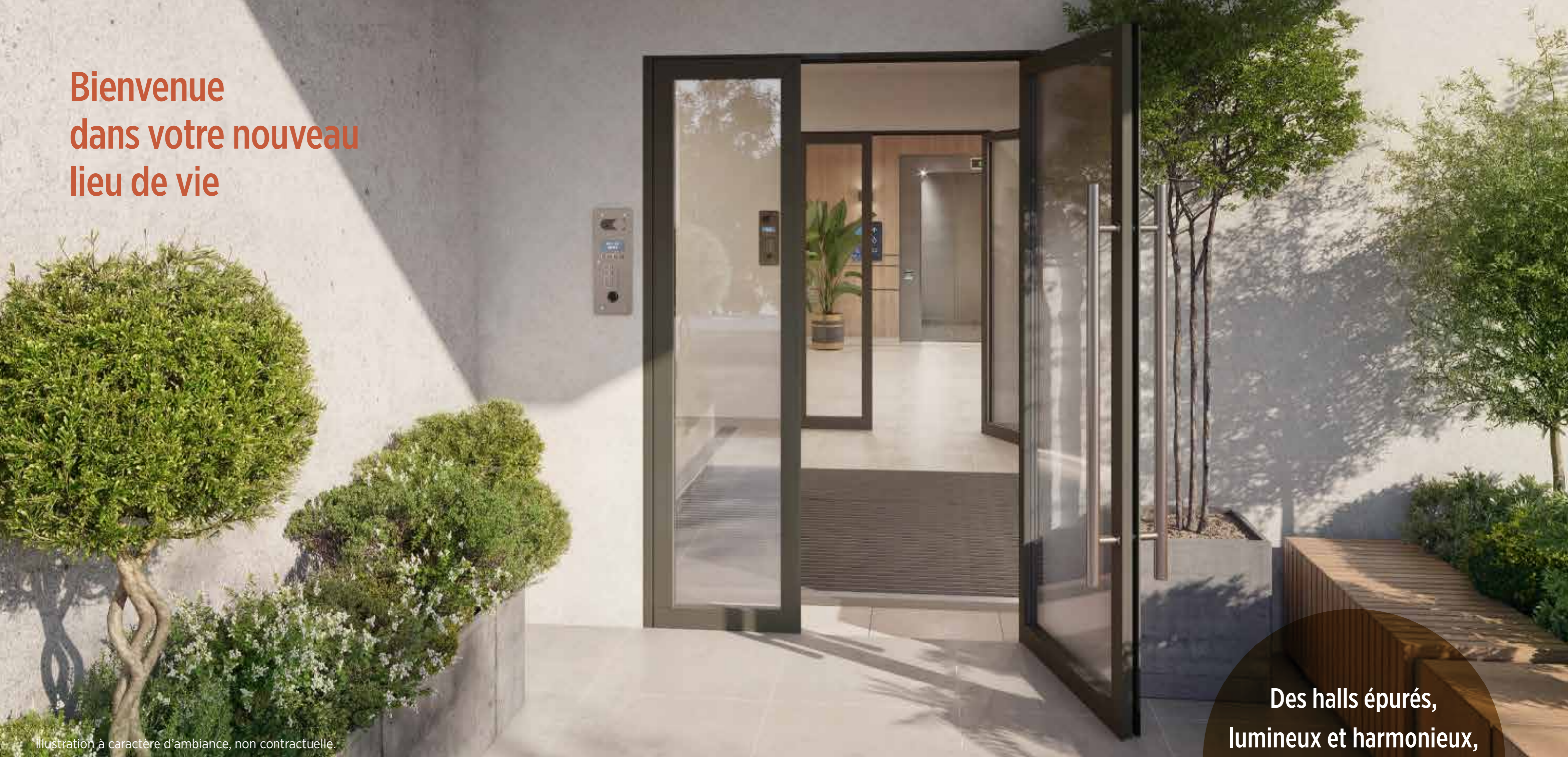
Illustration à caractère d'ambiance, non contractuelle.

Des halls épurés, lumineux et harmonieux, où les couleurs naturelles sont mises à l'honneur.